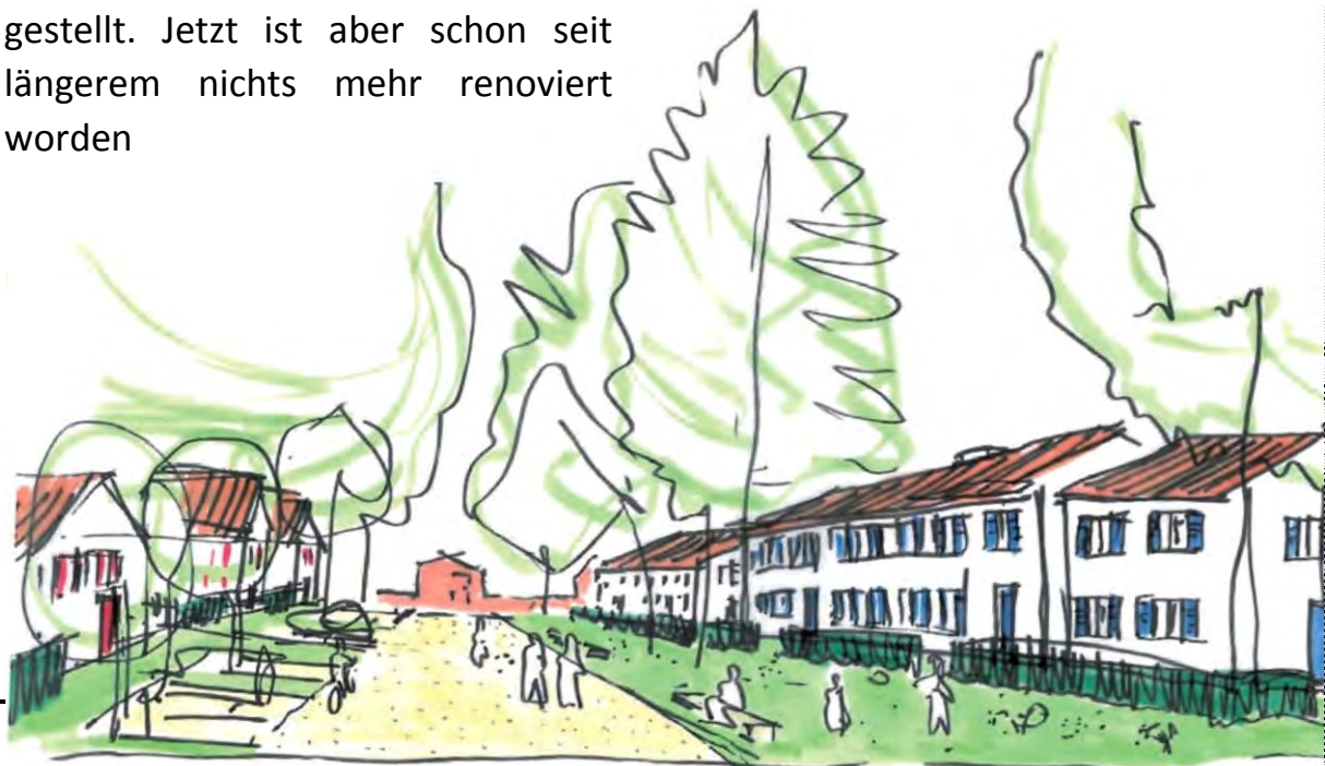
Skizzen: Büro KrischPartner, Universitätsstadt Tübingen

Die Familie wünscht sich ein modernes Heim, das den energetischen Standards und den Anforderungen an Grundriss, Fläche, etc. einer Familie entspricht. Dabei will die Familie das Haus möglichst lange nutzen, weshalb es auch für andere Lebensphasen geeignet sein soll.